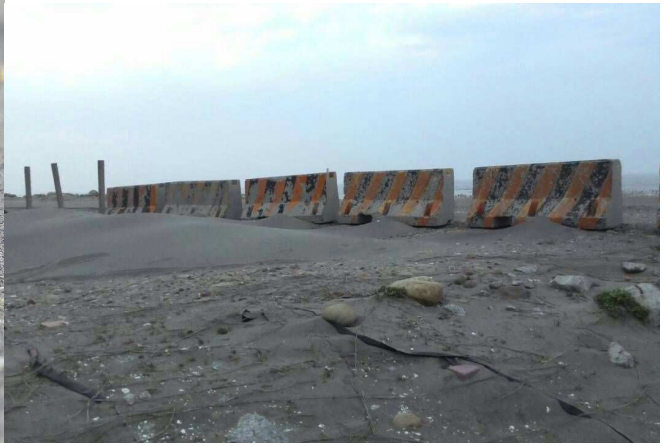
小燕鷗及棲息繁殖環境