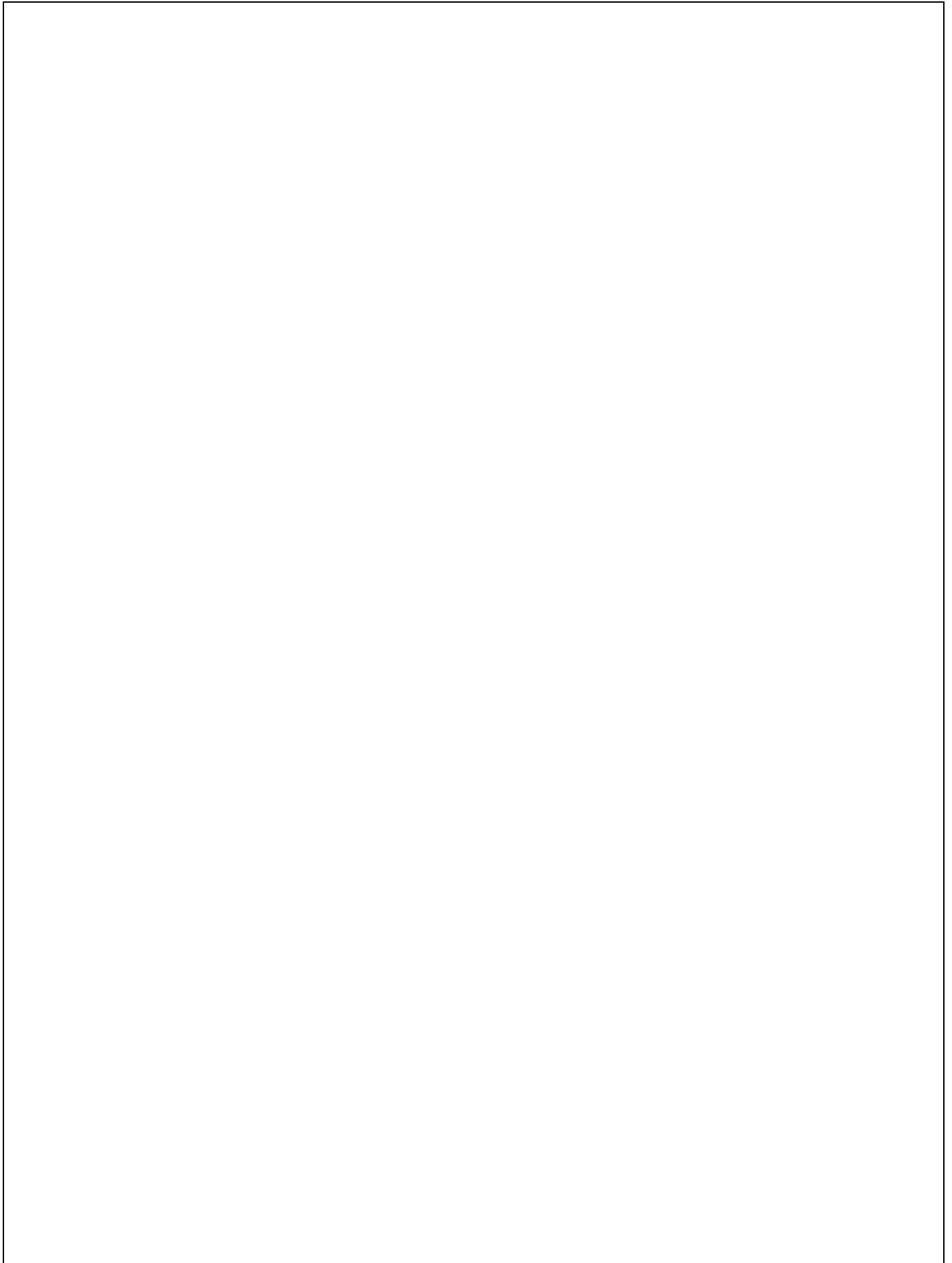
表 24. 資材採購單據黏貼處