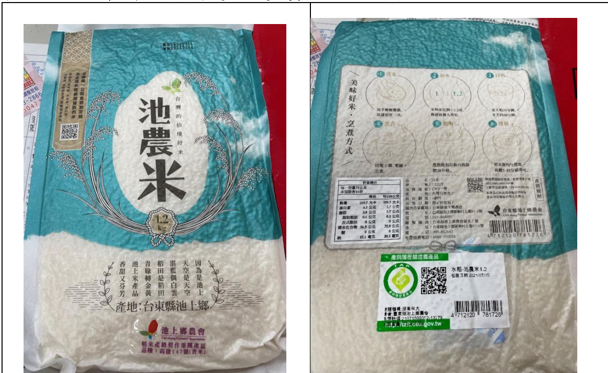
1. 完整包裝產品(內包裝)正反面