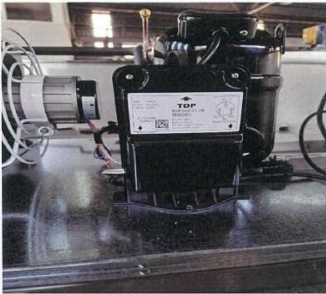
【照片一】馬達壓縮機組設備照片