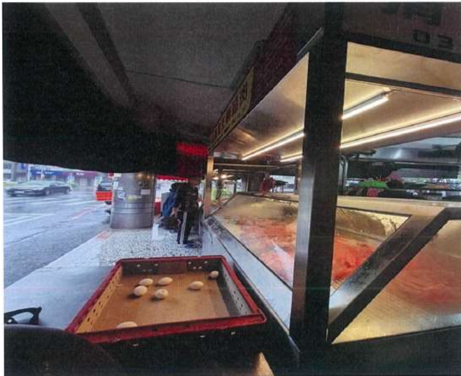
【照片三】設備近景（含完整設備、補助標示牌，須可清晰辨識標示牌文字）