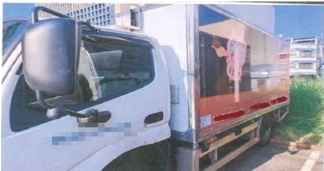
【照片三】車輛全身及補助標示牌完整照片1張（含完整設備，須可清晰辨識車牌號碼及標示牌文字）