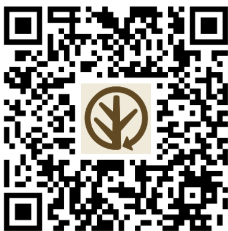
臺灣林產品生產追溯